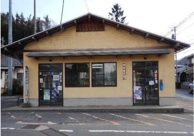
関越交通(株) 鎌田営業所 (片品村鎌田4078-7) (☎ 0278-58-3311)