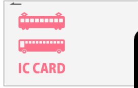
交通系 I Cカード