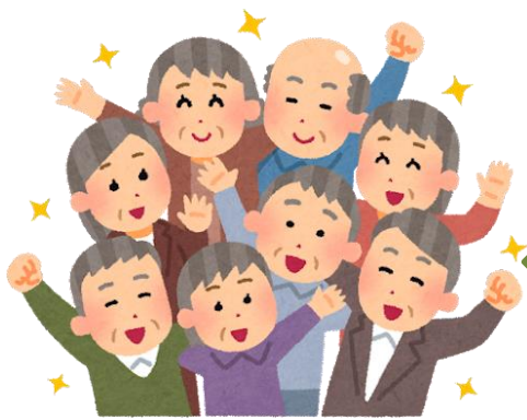
65歳以上の片品村民

※割引利用申込には、本人確認書類が必要 ※交通系 I Cカードの購入には、現金1,000円 （デポジット500円、 チャージ500円 ）が必要