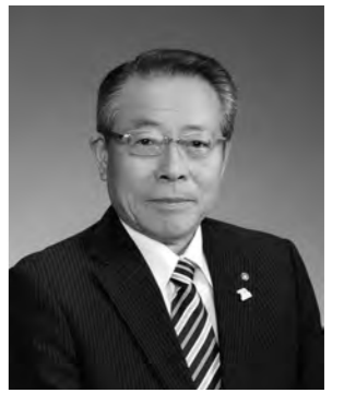
村長退任のごあいさつ

このたび、任期満了の11月12日をもって、3期12年にわたる片品村長の職を退任いたします。