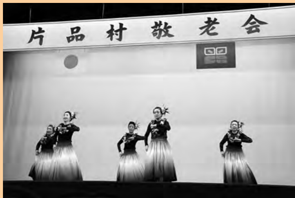
マカニの『フラダンス』