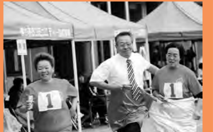
第59回村民運動会にて