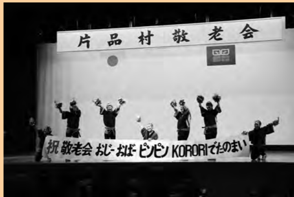
第6支部の『お祭りマンボ』