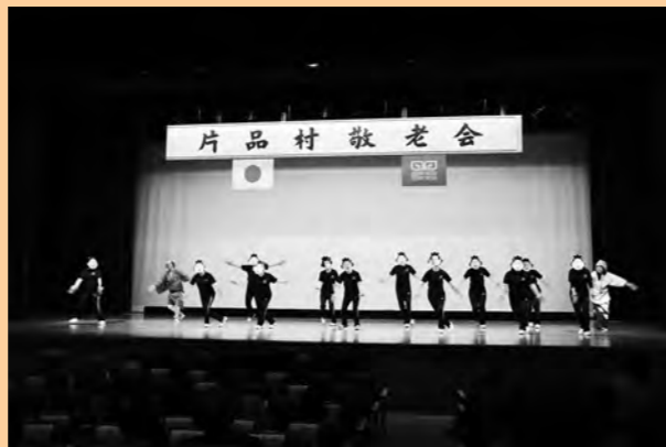
第8支部の『サザエさん』