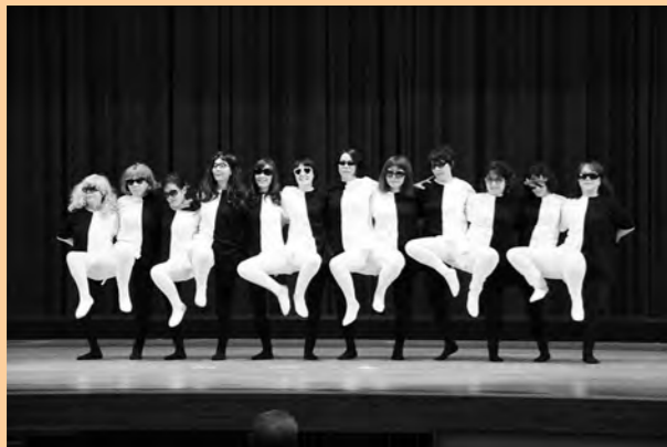
第5支部の『白黒ラインダンス』