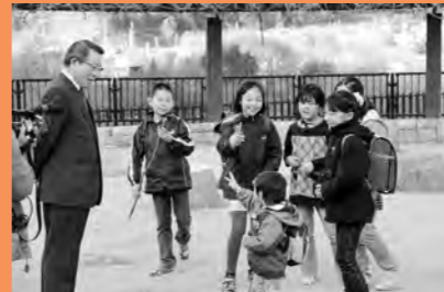
村長テレビ取材(テレビ朝日)にて