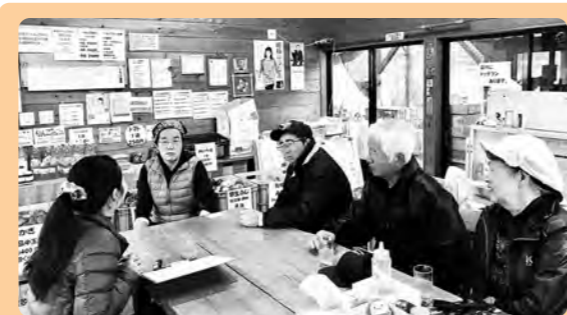
北毛茶屋 Facebook : https://facebook.com/hokumouchaya/ 住所：菅沼272-1

その夢いっぱいの取り組みを以下のページで発信しています。ぜひ応援よろしくお願いたします。