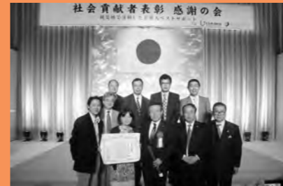
東日本大震災貢献者表彰にて