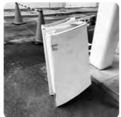
※誤った事例(洗濯機)

▼問い合わせ先 農林建設課 ☎(58) 2114 尾瀬クリーンセンター ☎(58) 2016