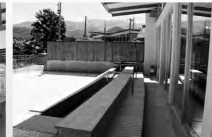
尾瀬の稜線を臨む足湯