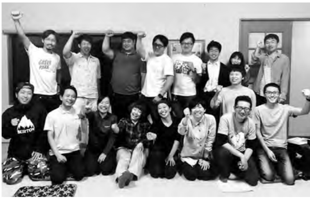
(文・中村菜由)

これからも地域ぐるみで片品村の「地域らしい」×「自分らしい」=「素晴らしい」暮らしを発信していければと思います。引き続きよろしく願いいたします。