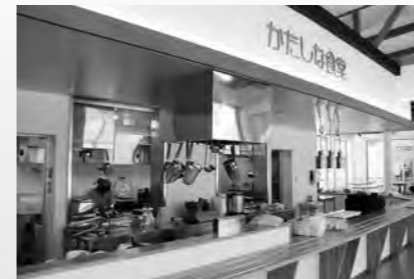
名水うどんかたしな食堂