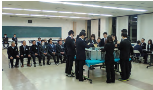
開票前の会場の様子 (片品村議選)