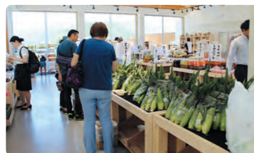
片品村の野菜は村外の方の人気の高い