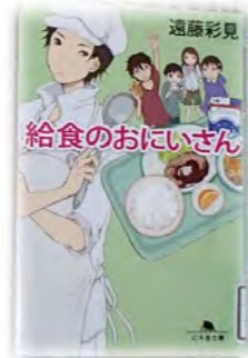
作 遠藤 彩見

給食は安心、安全、栄養満点。味は二の次、大量調理。敵は残菜率。くじびきハンバーグ、ふれあい給食、ネグレクト、アレルギー... 知恵と技をかけて食育に挑みます。「お前ら、口開けて待ってろ」