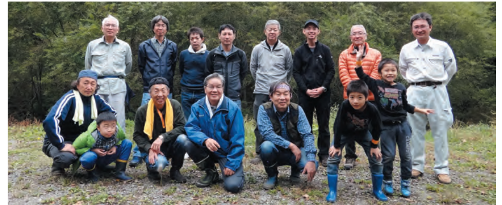
塗川支流・西俣沢において清掃活動をしていただいた皆さん