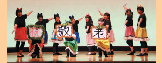
第4支部の『東京ブギウギ』