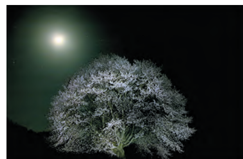
片品村副村長賞 『月光』