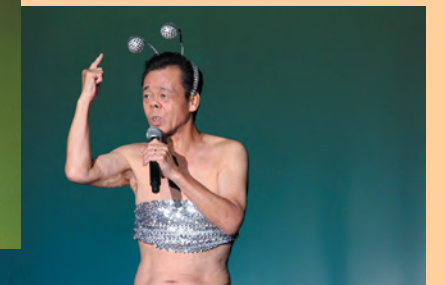
特別公演として清水アキラさんの『ものまねショー』