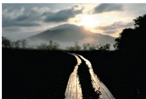
片品村議会議長賞 『黄金色の刻』