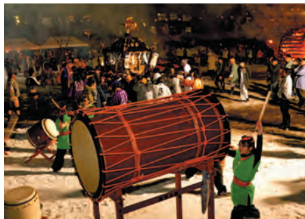
片品村長賞 『寒さを吹き飛ばせ』