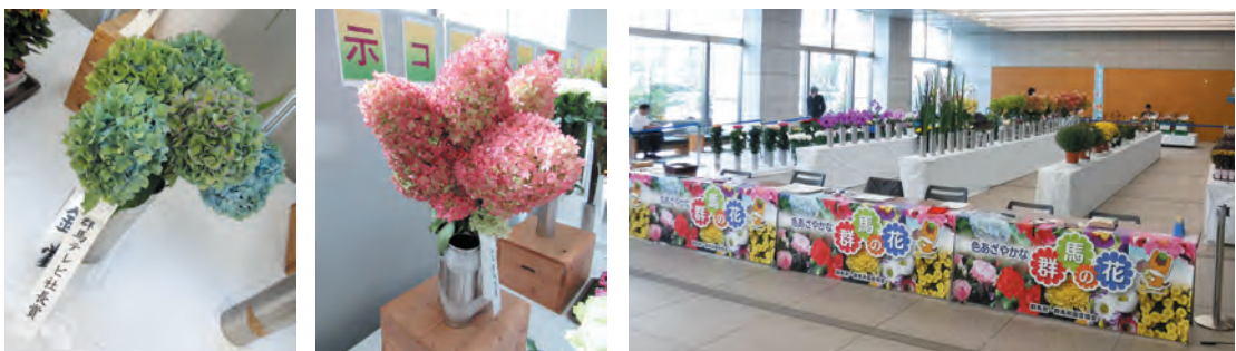
特別賞 群馬テレビ社長賞 最高賞 農林水産大臣賞 県品評会の様子