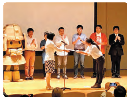
優秀事業に選ばれました