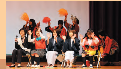
第3支部の『花咲小唄・他』