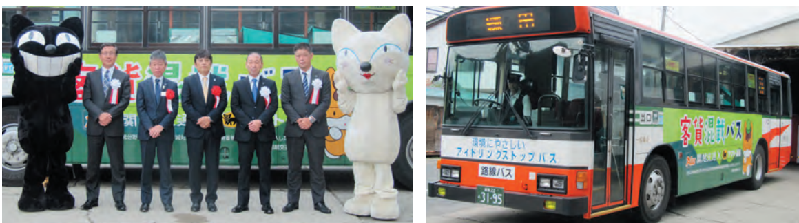
荷物を載せて路線を走る『貨客混載』バス