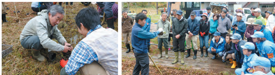
大清水湿原にミズバショウの植栽作業を行った皆さん