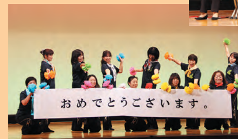
第1支部の『大阪すずめ』