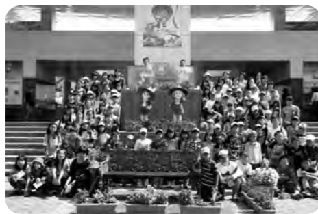
参加されたみなさん

9月29日(日)に栃木県にある東武ワールドスクウェアと日光猿軍団へ行ってきました。 今回は子ども会員、引率の役員、保護者総勢112名が参加しました。 ワールドスクウェアでは、世界の有名建築物や遺跡などを25分の1の縮尺で再現したのを見たり、撮影したりと、世界旅行に行った気分を味わい楽しめました。 また、猿軍団は今年で終園というところで、思い出に残してききました。 年々子供が減少傾向にある中、今年も多く参加があり、