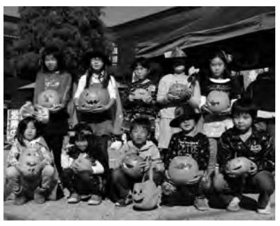
かぼちゃの切抜き上手にできたかな?

10月28日(月)群馬県民の日に、村の産物屋「かたしなや」において片品村景観審議会委員の皆様が中心となり、ハロウィンカボチャを切抜きランタンの作製を行いました。当日は、たくさんのお子様に参加して試行錯誤しながら切抜きを行いました。また、仮装してきてくれた児童には、お菓子のプレゼントを行いました。