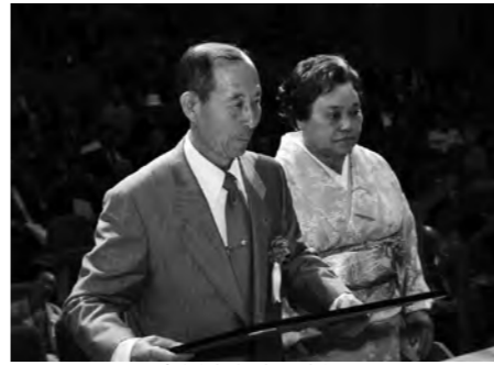
金婚表彰者の様子

午前11時から式典が行われ、金婚式・高齢者夫婦・米寿を迎えられた方々に慶祝状と記念品が送られ、来賓の方からお祝いの言葉をいただきました。式典終了後は、第2部のアトラクションとして、片品村婦人会(5支部・6支部・7支部・8支部)の皆さんによる踊り、また文化協会芸能部の皆さんによる舞踊やダンスが披露され、敬老会を大いに盛り上げていただきました。(保健福祉課)