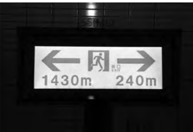
停電の際には自家発電システムが作動