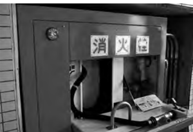
火災・事故等発生した場合のための消火栓

練馬ICから片品村まで1時間50分に 沼田ICからはたったの30分に 走行距離が3.5km短縮し、走行時間はなんと約15分短縮