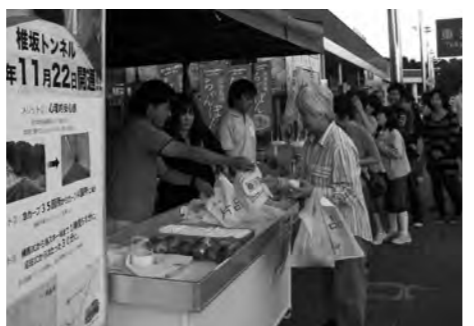
上里SAでのPRイベントの様子

尾瀬岩鞍の『ロックン』も参加しPRイベントを盛り上げてくれました。首都圏から約2時間と片品村までのアクセスが便利になることから、更に来村者・スキー場来場者が増加すると予想されます。今後も、引き続きトンネル開通に伴うアクセス向上を観光関係者一同で、周知・PR宣伝を行っていきたくと考えています。