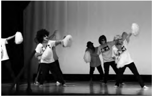
婦人会第8支部のみなさん