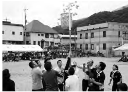
15連覇!!記録更新中の玉入れ第5区