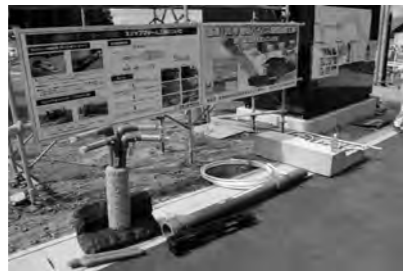
出入り口には地熱を使った融雪施設