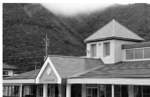
改修工事が済んだ片品保育園

片品保育所周辺の住民の皆さまには、大変ご迷惑をおかけ致しました。また、長い期間のご協力、ありがとうございました。(保健福祉課)