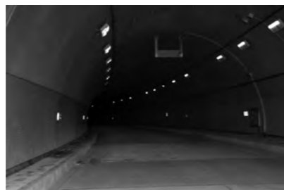
トンネルの照明はLEDライト(省エネ)