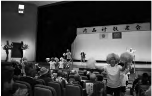
婦人会第7支部のみなさん