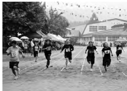
雨の中激走した100m女子20歳以上