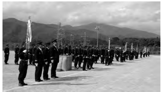
片品村消防団員 集合

10月12日(日)午後1時から片品中学校校庭で秋季点検が実施されました。団員は仕事を終えてからラッパ及びトランペット吹奏練習や東消防署にご指導いただきポンプ操法訓練、特別訓練を受けて臨みました。式では機械器具点検・部隊訓練・ラッパ吹奏・ポンプ操法、消防団員の力強さと正確な動作を披露しました。(総務課)