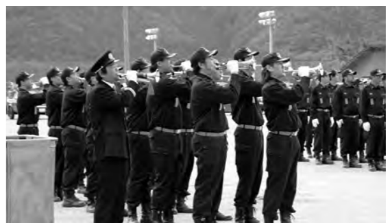
消防団ラッパ手吹奏の様子

10月12日(日)午後1時から片品中学校校庭で秋季点検が実施されました。団員は仕事を終えてからラッパ及びトランペット吹奏練習や東消防署にご指導いただきポンプ操法訓練、特別訓練を受けて臨みました。式では機械器具点検・部隊訓練・ラッパ吹奏・ポンプ操法、消防団員の力強さと正確な動作を披露しました。(総務課)