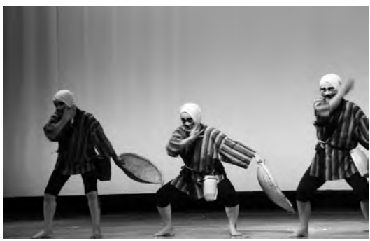
婦人会第6支部のみなさん