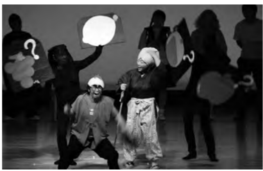
婦人会第5支部のみなさん