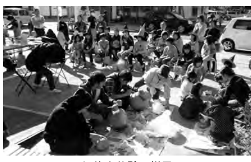
切抜き体験の様子

10月28日(月)群馬県民の日に、村の産物屋「かたしなや」において片品村景観審議会委員の皆様が中心となり、ハロウィンカボチャを切抜きランタンの作製を行いました。当日は、たくさんのお子様に参加して試行錯誤しながら切抜きを行いました。また、仮装してきてくれた児童には、お菓子のプレゼントを行いました。