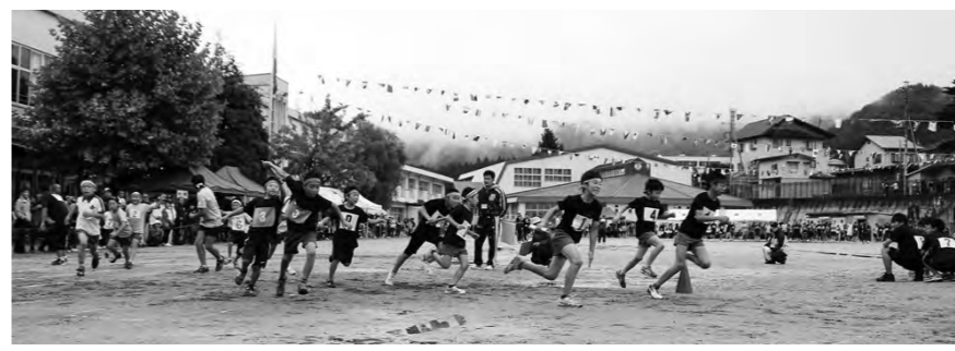
雨の中行われた区対抗リレーに選手も会場もさらにヒートアップ!!