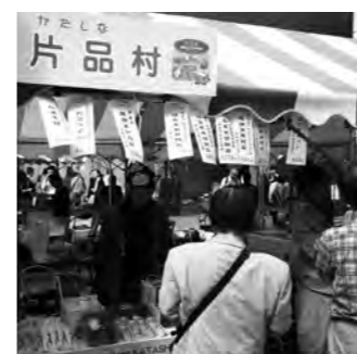
ぐんまの山村フェア会場の様子

10月17日(木)東京都政会館で「ぐんまの山村フェア in 東京」が開催され、片品村の特産・物産品販売を行いました。 昨年度からぐんまの山村・都市交流事業実行委員会主催で行われており、2回目の開催となりました。 来場者も売り上げも1.5倍と大盛況でした。 大勢の来場者に片品村のP