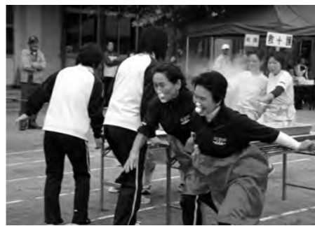
会場を盛り上げる婦人会リレー