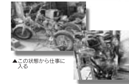
▲この状態から仕事に入る